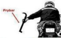
Asshole Driver Ahead Talking on Mobile