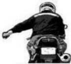
Bad Driver Ahead