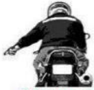
Potholes on Left