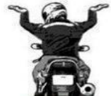
Dance Like an Egyptian