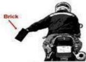
Asshole Driver Ahead